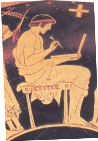
Ein Vorläufer des Laptop? (Vasenbild, 480 v. Chr.)

„Griechisch – kein Thema , ich konzentriere mich lieber auf lebende Sprachen, Mathe , Physik oder Biologie , ist doch logisch! “